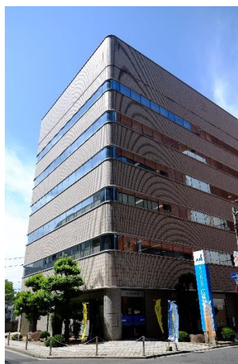
◆ 事務所外観 ◆