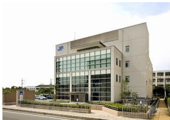
◆ 事務所外観 ◆