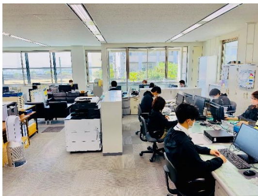
◆ 事務所内風景 ◆